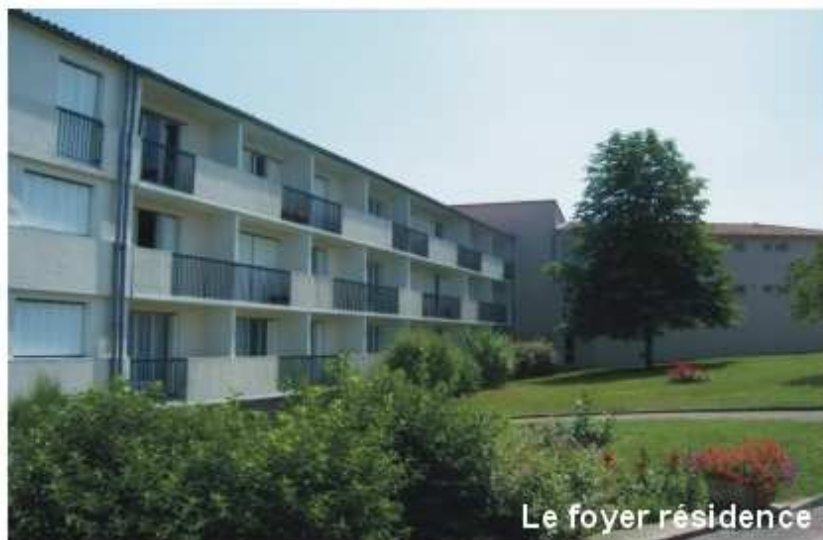
Le foyer résidence